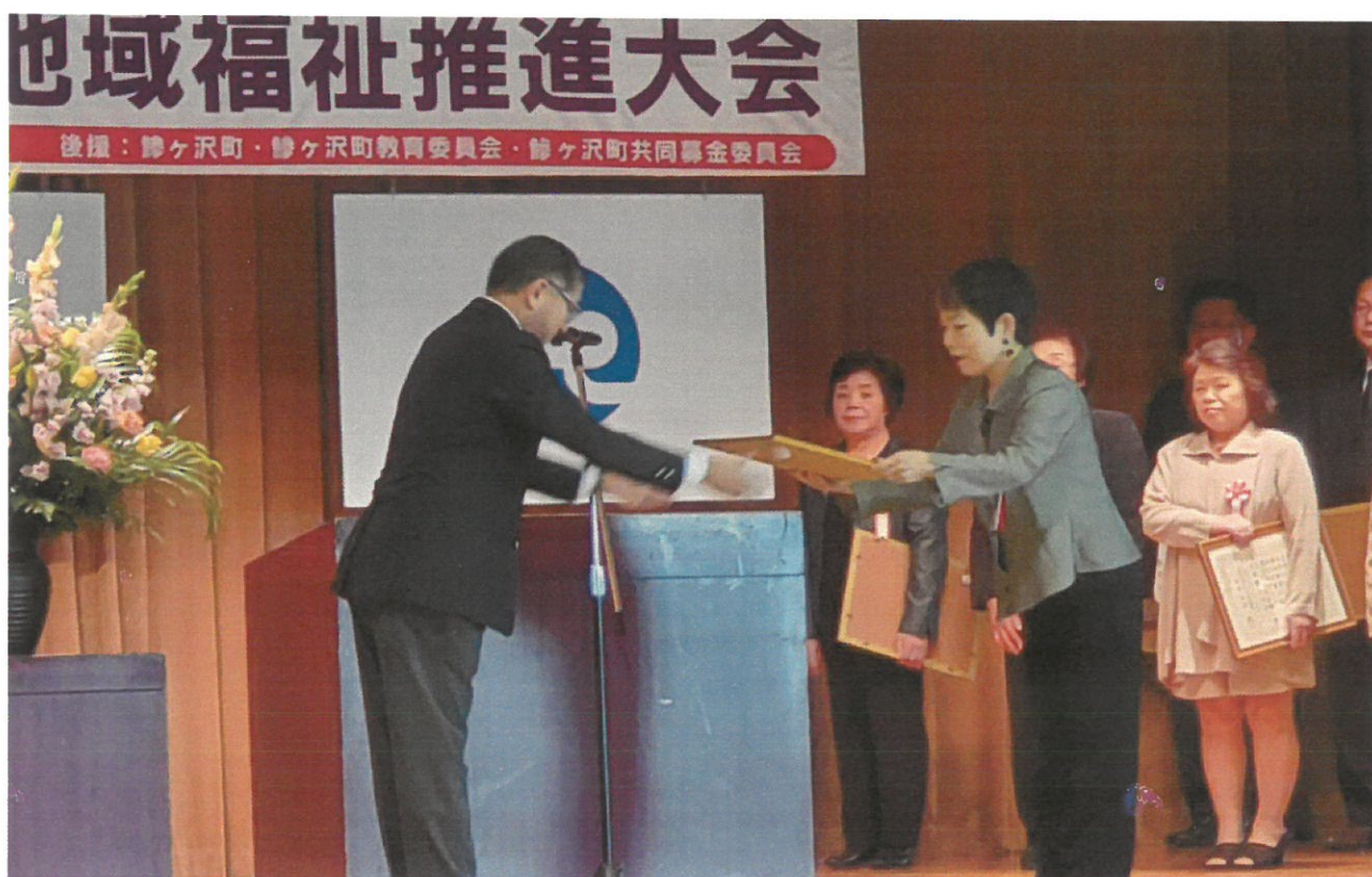
<今月の表紙> 地域福祉推進大会表彰式