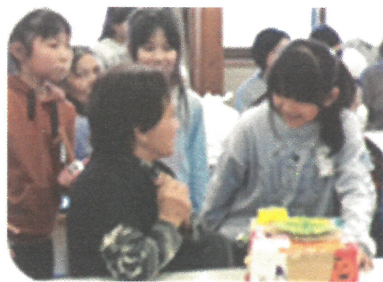
地域ふれあい交流会