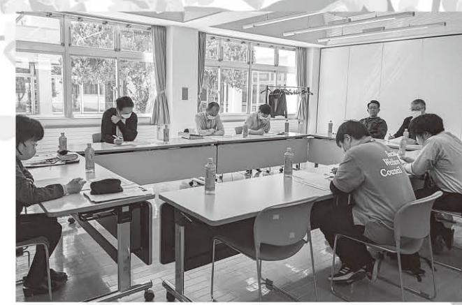
検討専門的判断会議

権利擁護センターあじがさわでは、鯉ヶ沢町と深浦町の権利擁護支援が必要な方（認知症高齢者、知的障がい者、精神障がい者）の日常生活等での困りごとを解決する方法（制度、事業等）を検討する中核機関として福祉・介護・司法・金融関係機関と連携しています。毎月定例の検討専門的判断会議を開催しています。